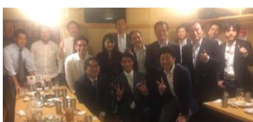
セミナー後の懇親会にて。

つまり、自社の手の内を丸裸にしたわけですが、出し惜しみすることなく、生々しい話まで赤裸々に語ったためか、非常に好評を頂く結果で終わることができました。